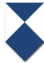
Figuur 1; Blauw-wit schildje